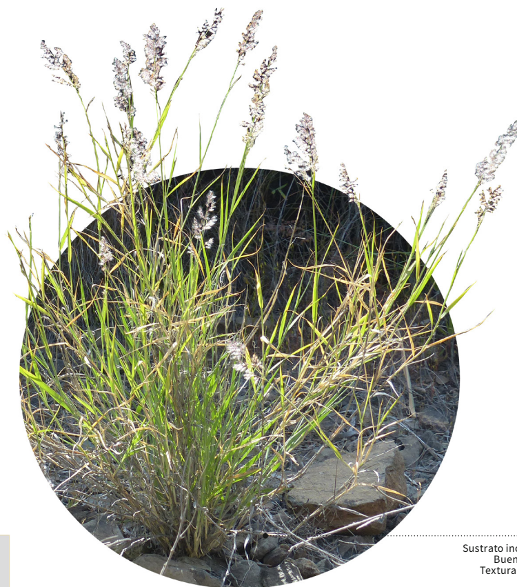
Sustrato inorgánico Buen drenaje Textura arenosa

Planta perenne de hasta 60 centímetros de altura que se caracteriza por su forma de crecimiento en matas y sus llamativas inflorescencias de color rojo púrpura , que atraen la atención cuando florecen. Se trata de una especie adaptable a una amplia variedad de entornos .