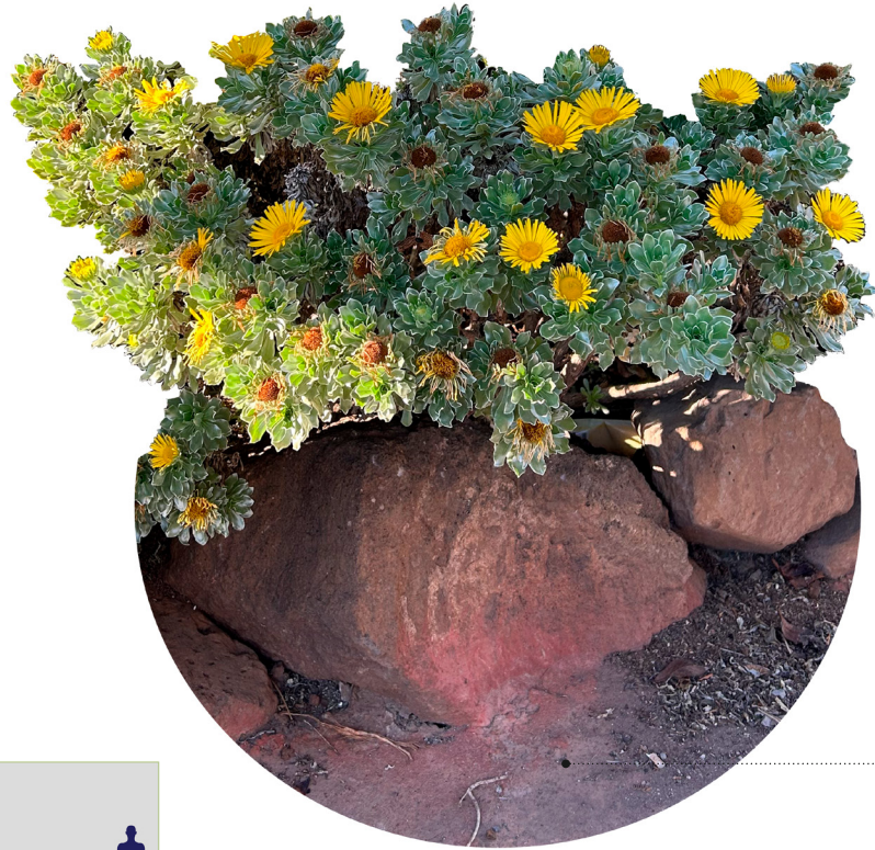
Sustrato inorgánico Buen drenaje Textura arenosa

Arbusto con aroma intenso, muy ramificado desde la base . Crece cubriendo todo el terreno que tiene a disposición. Las hojas y flores son más grandes y anchas que las del Asteriscus intermedius . Es una especie muy usada en jardinería por su bonita floración amarilla.