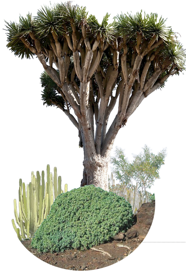
Sustrato orgánico Buen drenaje Mantillo de hojas

Se trata de una de las especies más destacadas de la flora del archipiélago canario , el símbolo vegetal de la isla de Tenerife. Cuenta con un tronco grueso y robusto de tonalidades grisáceas. El drago se caracteriza por ser muy longevo, pudiendo alcanzar centenares de años de vida.