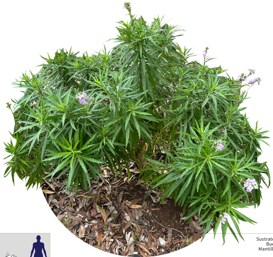
Sustrato orgánico Buen drenaje Mantillo de hojas

Pequeño arbusto de hojas finas y alargadas , familia de las coles y berros, entre otros. Se trata de una especie endémica de las islas, ausente en Lanzarote. Presenta flores de color blanquecino-violeta que se presentan en racimos .