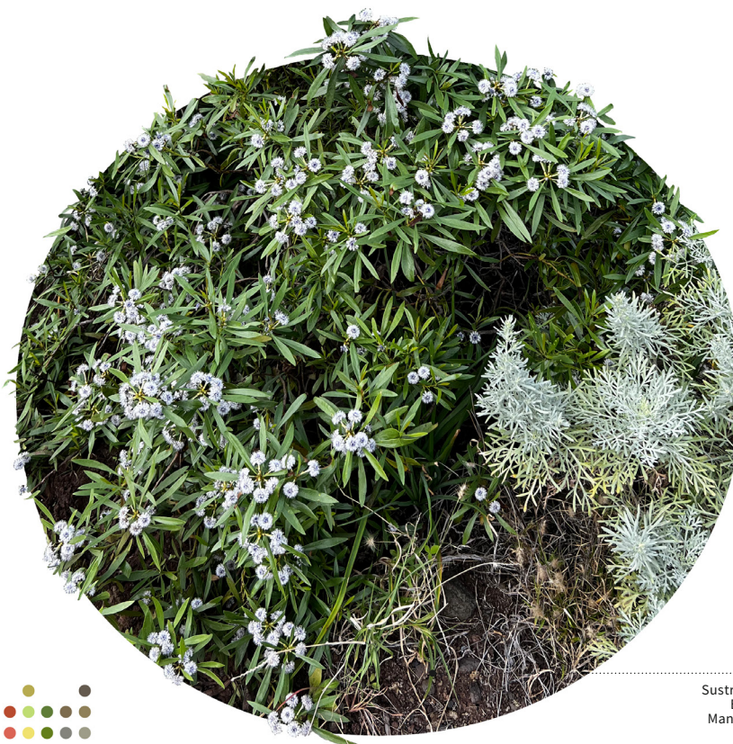
Sustrato orgánico Buen drenaje Mantillo de hojas

Arbusto leñoso que puede alcanzar hasta 2 metros de altura. Es una especie siempreverde de porte algo globoso con corteza marrón, hojas lanceoladas agrupadas en rosetas y en cuyo centro brotan vistosas flores blancas y azuladas en su centro.