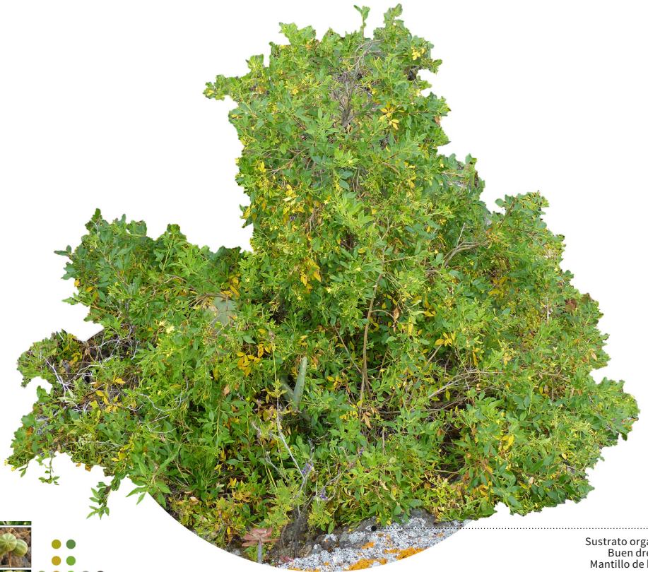
Sustrato orgánico Buen drenaje Mantillo de hojas

Arbusto de mediano tamaño frecuente en jardines y zonas verdes debido a su uso por su bonita floración amarilla , que desprenden un aroma muy agradable típico de los jazmines.