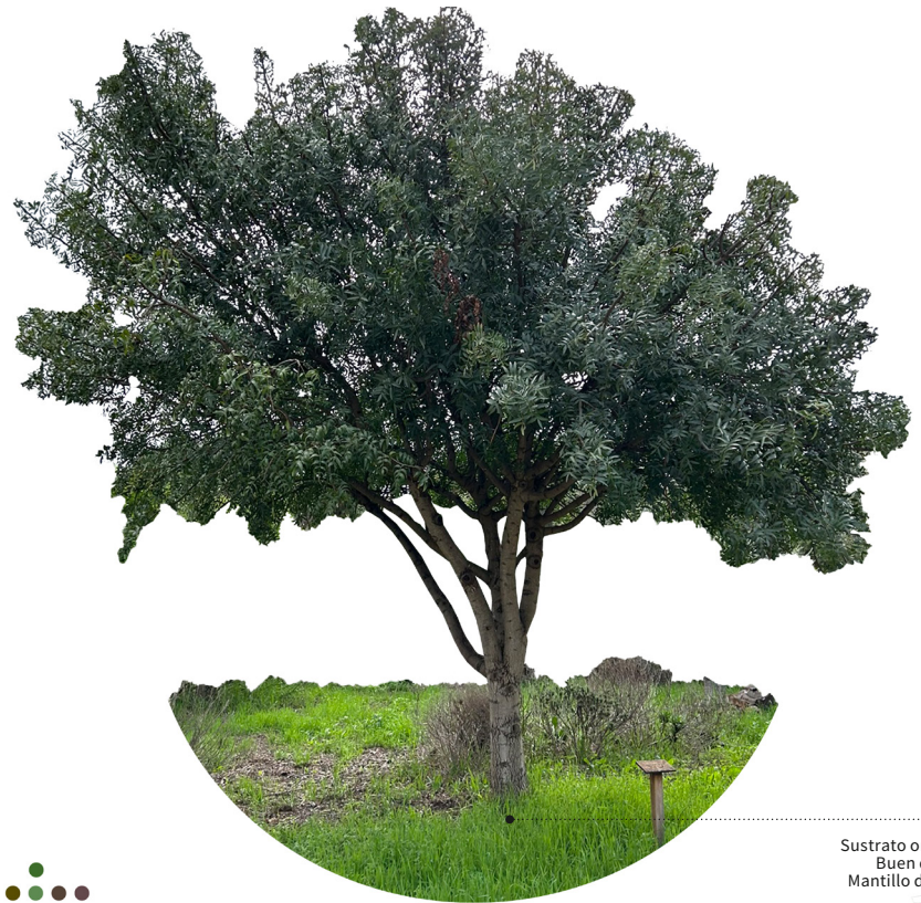
Sustrato orgánico Buen drenaje Mantillo de hojas

Árbol que, por lo general, ronda una altura de entre 5 y 7 metros, pero que en ocasiones puede llegar a alcanzar los 12 metros. Se trata de una de las pocas especies arbóreas caducifolias presentes de manera natural en el archipiélago canario.