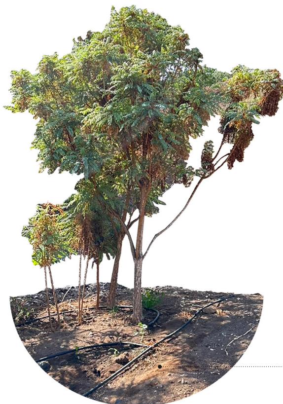
Sustrato orgánico Buen drenaje Mantillo de hojas

Arbusto que puede alcanzar hasta 4 metros de altura, formando una copa ancha y abierta . Recibe su nombre común a causa del color rojizo de su tronco y ramas , especialmente las más jóvenes, cubiertas también de pequeños pelos. Las hojas son compuestas con una coloración verde-glaucá . Los pies masculinos producen pequeñas flores amarillentas , mientras que los femeninos producen flores rojo-púrpúreas .