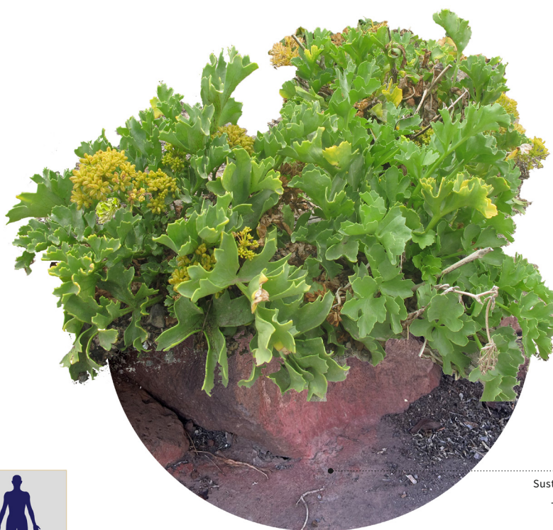
Sustrato inorgánico Buen drenaje Textura arenosa