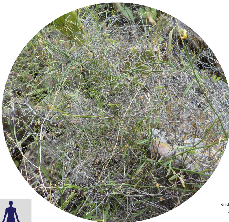
Sustrato inorgánico Buen drenaje Textura arenosa