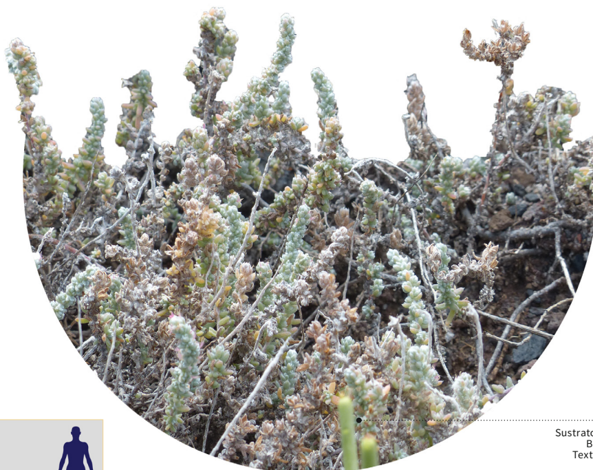
Sustrato inorgánico Buen drenaje Textura arenosa