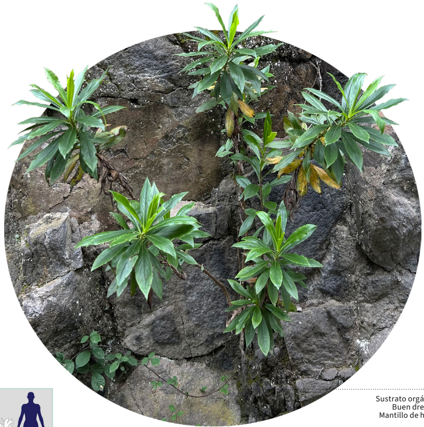
Sustrato orgánico Buen drenaje Mantillo de hojas

Arbusto leñoso de hasta un metro y medio de altura. Presenta hojas brillantes de borde aserrado e inflorescencias erectas y densas muy características . Las llamativas flores son tubulares y tienen un color rojo-fuego o anaranjado , siendo distintivas de esta especie. Sus frutos son cápsulas que contienen numerosas semillas diminutas en su interior. Es uno de los elementos más vistosos de la laurisilva, junto con el bicácaro.