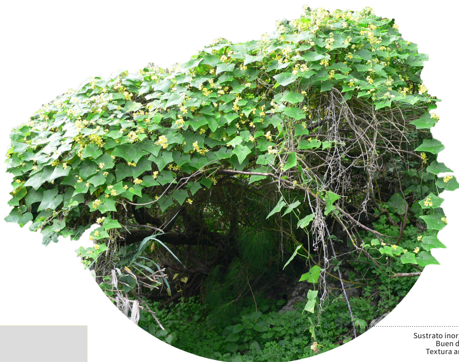
Sustrato inorgánico Buen drenaje Textura arenosa