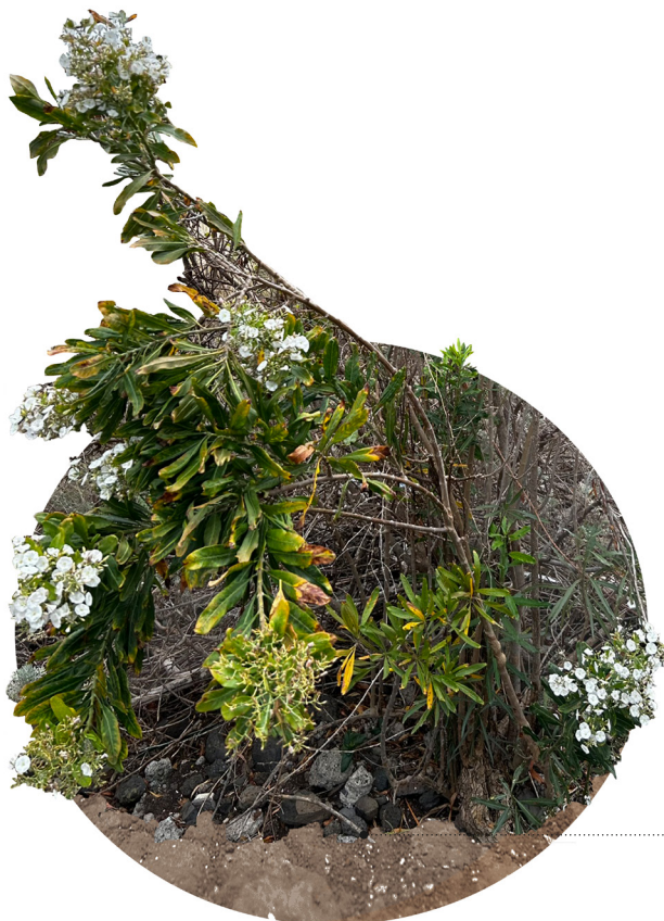
Sustrato inorgánico Buen drenaje Textura arenosa

Arbusto arbóreo, leñoso que cuenta con unas vistasas inflorescencias blanquecinas, algo rosadas . Se trata de una especie endémica presente en todas las islas del archipiélago, exceptuando La Graciosa, siendo menos abundante en las islas más orientales. Es una especie ampliamente empleada con finos ornamentales debido a algunas de sus características como su rápido crecimiento y su llamativa floración .