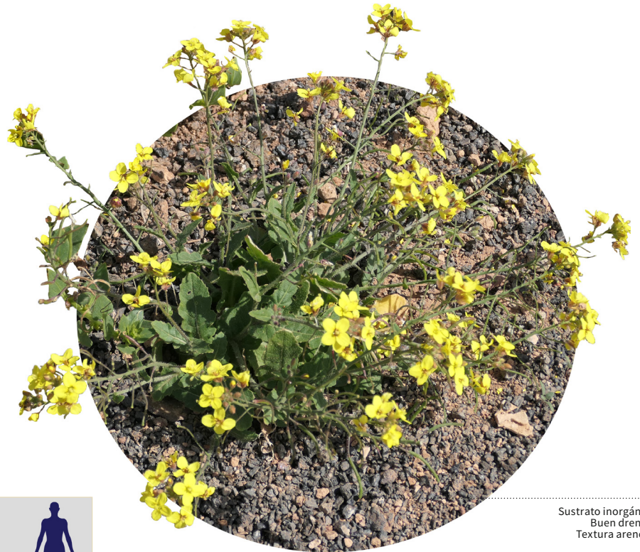
Sustrato inorgánico Buen drenaje Textura arenosa

Es una planta herbácea frecuente en zonas antropizadas y cercanas a la costa de todas las islas a excepción de El Hierro. No alcanza más de 30 centímetros de altura y presenta florejillas amarillas que, en conjunto, pueden conformar amplios prados de esta tonalidad.