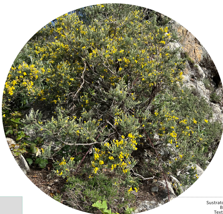
Sustrato inorgánico Buen drenaje Textura arenosa