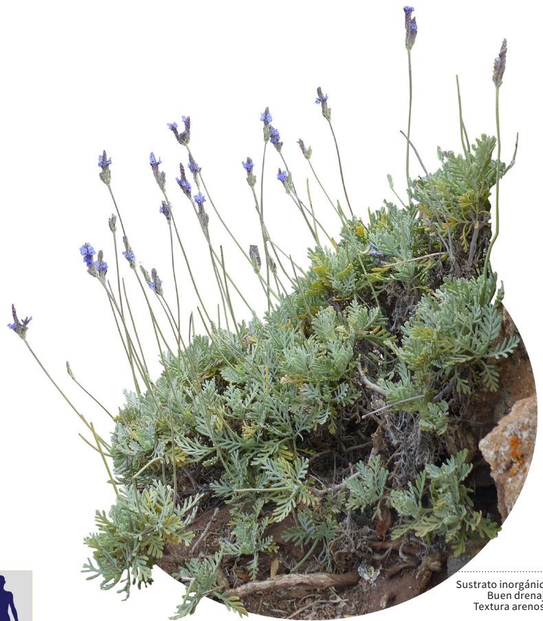
Sustrato inorgánico Buen drenaje Textura arenosa