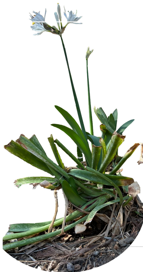
Sustrato inorgánico Buen drenaje Textura arenosa

Se trata de una planta herbácea bulbosa que puede alcanzar hasta los 80 centímetros de altura. Esta especie presenta unas hojas basales de color verde y durante su floración da lugar a unas flores grandes y blancas de olor agradable . Esto y la facilidad de su cultivo, hacen que esta especie sea muy apropiada para su uso ornamental .