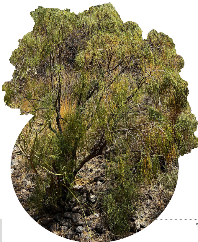
Sustrato inorgánico Buen drenaje Textura arenosa