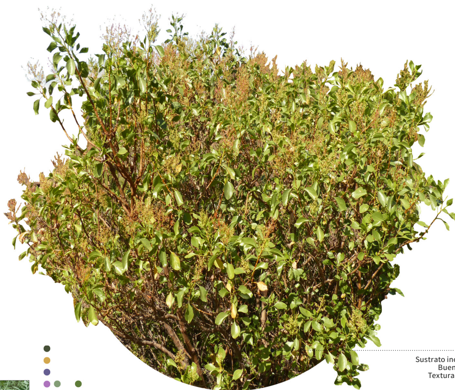
Sustrato inorgánico Buen drenaje Textura arenosa